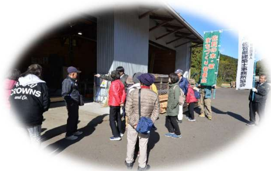
多良岳材加工施設見学/太良町