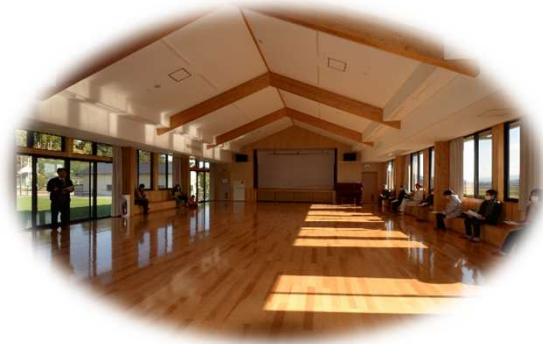
県・市産材活用公民館見学/武雄市