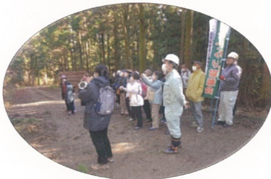
杉材の伐倒状況について研修/七山村