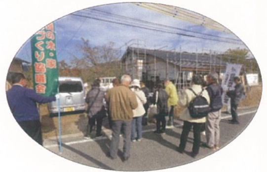
古民家移築・再生見学/大和町