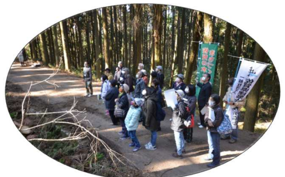
昨年の木造塾見学会（伐採の実演中）・嬉野市