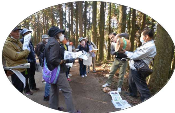
昨年の木造塾見学会（森に入る前の事前説明）・嬉野市